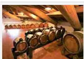
Acetaia Comunale, Palazzo Scacchetti Carpi

EmiliaFoodFest si presenta come un vero e proprio festival, si potranno incontrare chef del panorama gastronomico nazionale ed internazionale scoprendo la loro storia e il loro stretto legame con il territorio ma anche spettacoli itineranti per le vie del centro con sbandieratori e musica per accompagnare il pubblico.