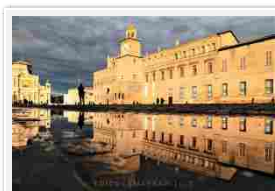
Castello del Pio

Il Cortile d'Onore di Palazzo dei Pio farà da cornice in tutto il suo splendore a tavole rotonde, premiazioni, talk show e degustazioni guidate.