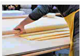
Mani in pasta e disfida sfoglino