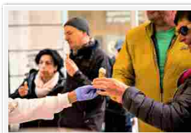
Assaggi tra gli stand

intrattenimento e animazione per una tre giorni imperdibile in compagnia della mascotte di EmiliaFoodFest: "Rina, la Rezdorina", ce n'è per tutti i gusti e per tutte le età.