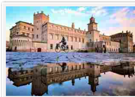
Palazzo dei Pio