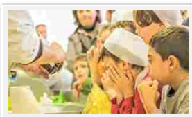
Laboratori mani in pasta bambini

Non solo gusto e tradizioni, ma anche cultura, sarà possibile scoprire Carpi attraverso i suoi monumenti, la sua storia e le sue leggende con visite guidate realizzate ad hoc per l'occasione e vivere un'esperienza a 360°.