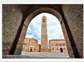
Pieve di Santa Maria in Castello