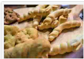
Pane del territorio